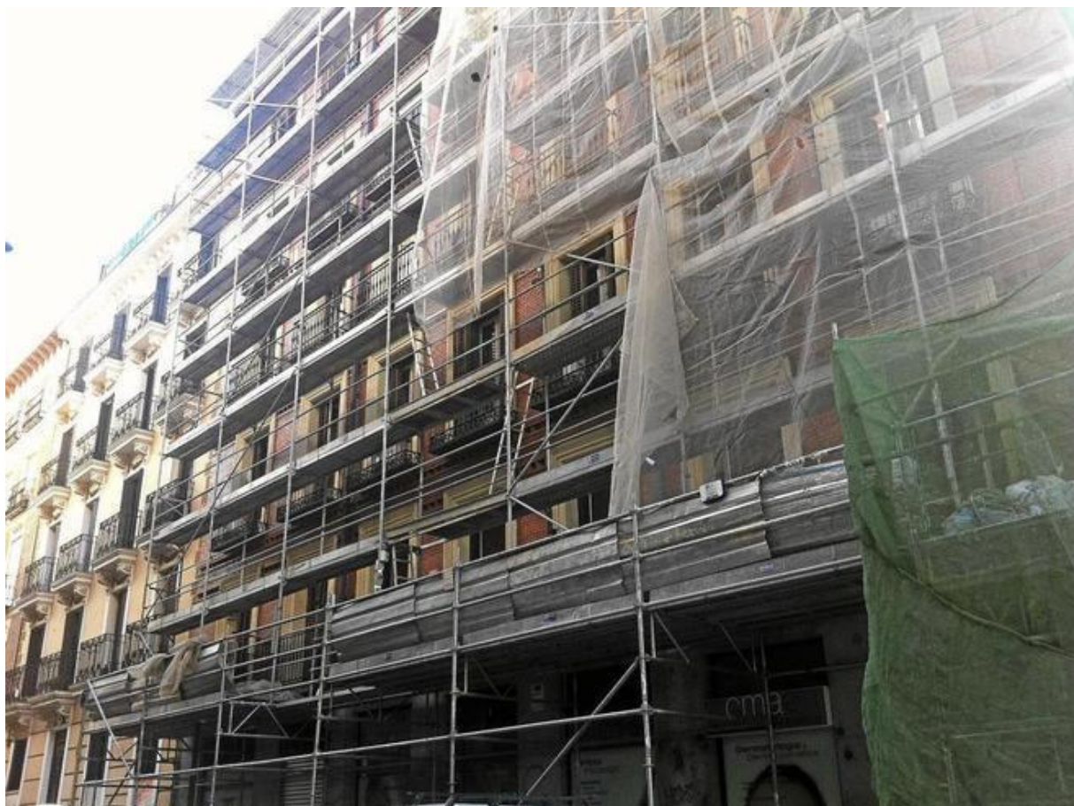
Rehabilitación de la fachada de un bloque de viviendas.

El país se encuentra en la lista de los peor valorados junto con Croacia, Francia, Grecia, Hungría, Italia, Irlanda y Polonia